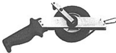
Slika 2: Mjerilo duljine s mjernom trakom tipa 464-SR