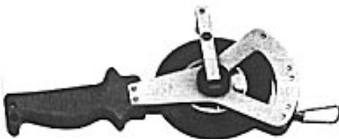
Slika 3: Mjerilo duljine s mjernom trakom tipa 464-V